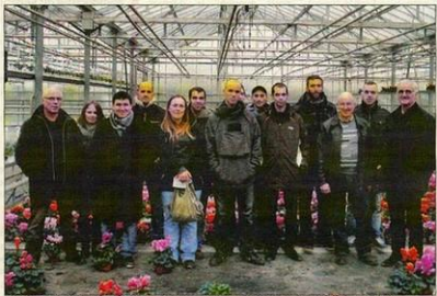
Les salariés du Geiq se sont retrouvés à Beaufort-en-Vallée aux côtés de plusieurs entreprises adhérentes du groupement pour faire le bilan de l'année écoulée.

Pour l'ensemble des adhérents, le groupement répond avant tout à un besoin de recrutement à temps plein ou partiel. Cependant, cet